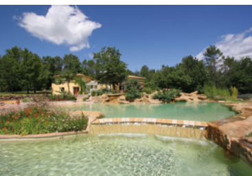
Diffazur – Alonzo