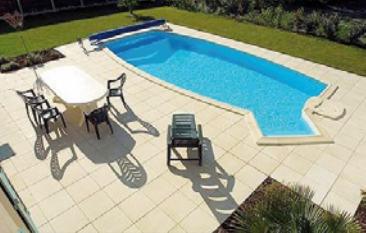
Piscine Caron – Optima