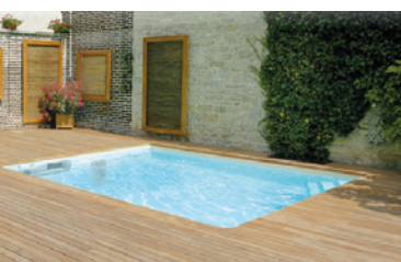
Magiline – Magismile

Si globalement, on confie la construction à un professionnel, certains achètent des kits et font eux même leur bassin tout ou en partie. Les plus bricoleurs peuvent ainsi profiter des joies de la baignade grâce à la piscine Irrijardin , premier prix à partir de 3000 € (hors main d'œuvre, terrassement, margelle et raccordement). Il en est ainsi par exemple chez Magiline qui nous confie que « devant l'engouement pour le bricolage, les piscinistes ont mis au point des kits pour des gens prêts à se lancer. Il est possible de s'offrir un bassin de 8 mètres sur 4, pour un prix avoisinant les 7 000€ ». Desjoyaux dans le cadre de ses portes ouvertes propose régulièrement des prix doux sur 3 modèles de piscines : la classique, la benjamine, l'Amérique ; 3 modèles anciens d'entrée de gamme qui plaisent et restent très abordables tout en disposant de système de filtration plus ou moins intégré dans la margelle en fonction des modèles. Pour le modèle le plus vendu de 8 mètres sur 4, il faut compter un budget à partir de 14 000€.