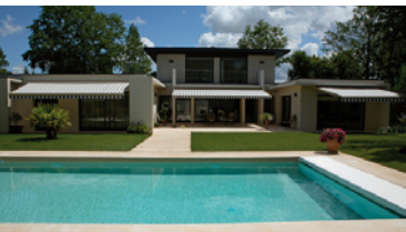
Piscine Caron – Classique