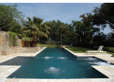
Diffazur – Weissleb