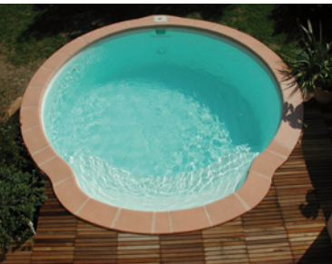
Alliance Piscine – Nacre