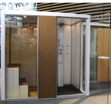
Nordique France TYLÖ

Autre tendance, la combinaison de différents éléments entre eux. D'un côté Le spa s'intègre à la piscine, de l'autre TYLÖ distribué en exclusivité par Nordique France, combine dans une seule cabine hammam et sauna.