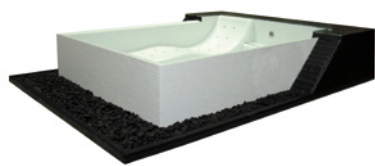
Clair Azur – Horizon